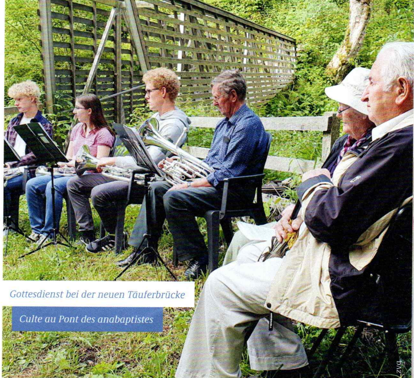
Gottesdienst bei der neuen Täuferbrücke